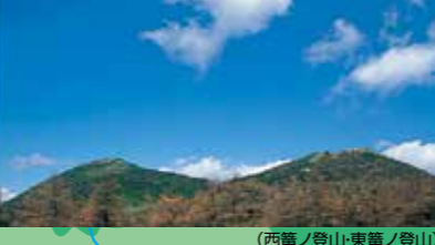
(西麓ノ登山・東麓ノ登山)

【所要時間】 ●西麓ノ登山~東麓ノ登山コース 1時間40分(池の平駐車場登山口への往復) ●水ノ塔山への縦走コース 1時間40分(小諸市高峰温泉登山口へ下山した場合) ●水ノ塔山への縦走コース 2時間30分(池の平駐車場登山口への往復) 【駐車場】 池の平駐車場(5月~10月普通車600円、中型車2,500円 大型車3,500円)普通車100台・大型30台 【アクセス】 ●湯の丸高原-池の平駐車場-登山口まで 東部湯の丸ICから40分 上田駅-佐久平駅からタクシー-1時間15分 田中駅よりタクシー-45分-滋野駅からタクシー-40分 ●小諸市からの池の平駐車場-登山口まで 小諸ICから50分 佐久平駅からタクシー-1時間15分 小諸駅からタクシー-55分 ※湯の丸高峰林道開通期間 4月下旬~11月中旬 期間は気象条件により変動する場合があります。 【問い合わせ】 東部市役所商工観光課 Tel:0268-64-5895