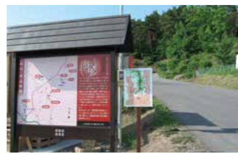
〈ふるさと農道から入った登山道入口〉

※季節ごとにさまざまな植物野草を楽しむ。 ※樹木には名前の札が。 【所要時間】 一周約2時間 【駐車場】 有…金剛寺公民館 普通車5台 【アクセス】 上田管平ICから5分 上田駅からタクシーで25分 上田駅からバス20分「伊勢山」バス停下車 【問い合わせ】 上田市観光課 Tel:0268-23-5408